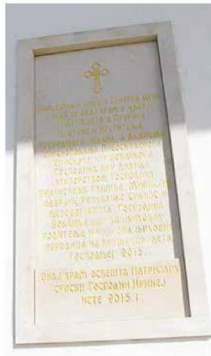
Заслужни за цркву: Свети Јован Крститељ и Братислав Гашић

Ову хвалисавост доброделништвом није могуће доживети у Бајчетини, родном месту Томислава Николића, где председник подиже Храм Светог великомученика Димитрија. Извор нас је упозорио да је црква „опкољена полицијом и да не може да јој се приђе“, а на путу ка будућем храму мимоишли смо се са два полицијска ципа и још једном патролом приде. Председнику или његовом тиму толико је, чини се, стало да његово добротворство – црква, асфалтиран пут и свеже офарбане бандере које га уоквирују – за сада остане у тајности надморске висине Бајчетине (809 метара), да су се побринули и да крај цркве пободу знак који без